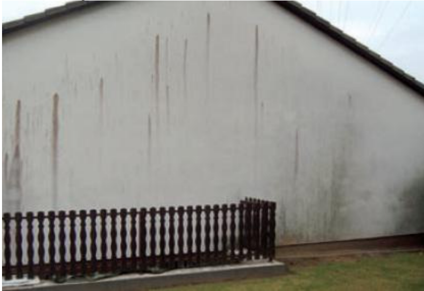
Mikrobioloogiline taimkate krohvfaasidil