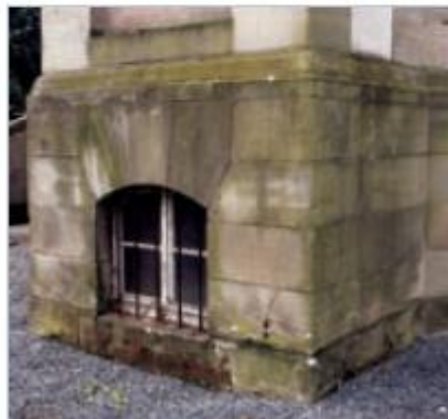
Mikrobioloogiline taimkate erinevatel pindadel